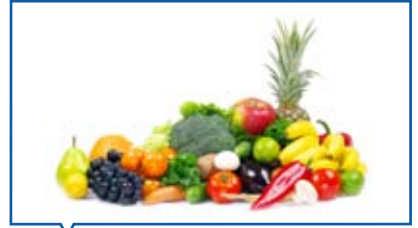
Obst und Gemüse