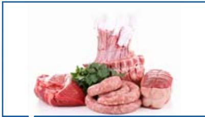
Fleisch und Wurstwaren