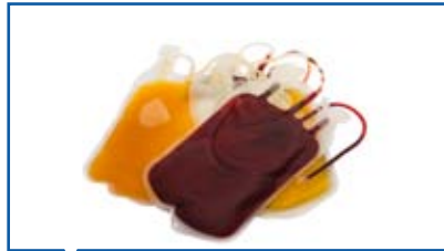
Blut- und Plasmatransport