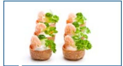
Catering und Eventservice