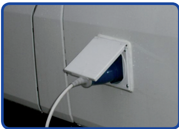
Außensteckdose 230 V für Standkühlung

VW Caddy Radstand: Caddy 2682 mm Caddy Maxi 3002 mm Flügeltüren oder Heckklappe Dachform: Serie Motorisierung: 1,2 | TSI 63 kW / 86 PS m K 1,2 | TSI 77 kW / 105 PS m K 1,6 | TDI 55kW / 75 PS m/o K 1,6 | TDI 75 kW / 102 PS m/o K 2,0 | TDI 81 kW / 110 PS m/oK 2,0 | TDI 103 kW / 140 PS m/o K 2,0 | 80 kW / 109PS m K (Erdgas) m/o K = mit/ohne Klimaanlage