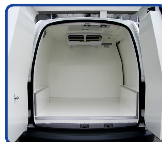
Laderaum in Standardausführung